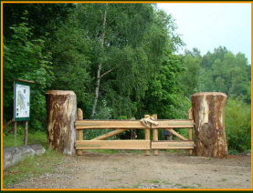
Parkplatz - Eingangstor