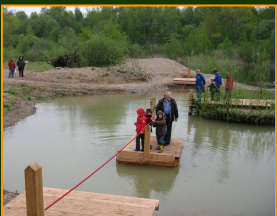
Seilfähre - Badeteich