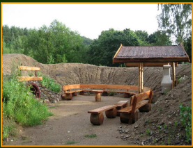
Atrium, Grillplatz, Tunnel